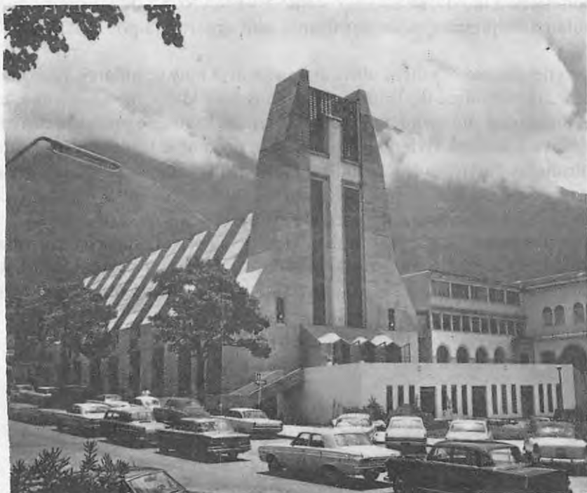
Recuerdo de la Consagración del Templo Nacional de "San Juan Bosco" Altamira.

Las Damas Salesianas pensaban exactamente igual: el Templo Nacional de San Juan Bosco para gloria de Dios y, el Complejo Social de Altamira, para bien de los pobres.