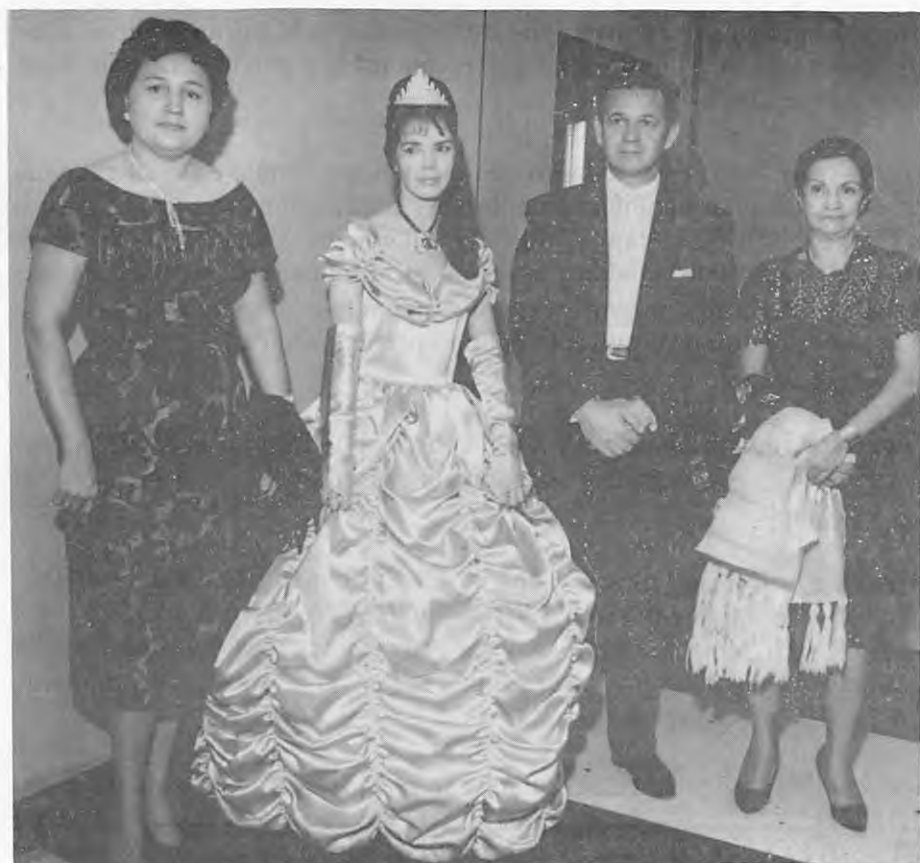
...un evento social o festival benéfico con una famosa artista lírica del momento Rosalinda García, su señora madre y el apoderado Zaro...