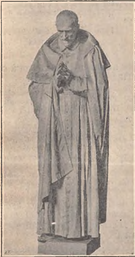
Saint Vincent de Paul.

Nous saisissons cette occasion pour demander à toutes les âmes qui aiment la Vierge de Don Bosco de nous aider à supporter les frais de modelage et de sculpture, dont le total atteindra plusieurs milliers de francs.