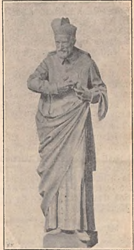
Saint Philippe de Néri.