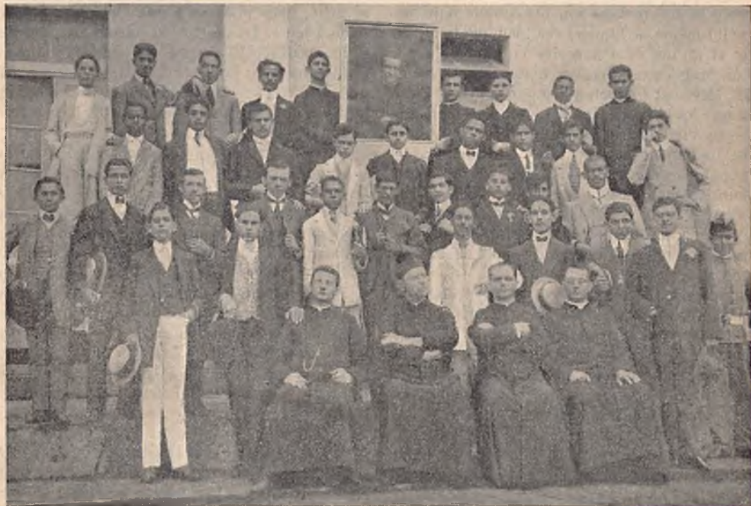
BAHIA (Brésil) — Les Ancien Élèves du « Lycée do Salvador ».

L e premier et principal membre de la famille est le père. « Toute paternité dit S. Paul, vient de Dieu qui la donne à qui il lui plaît ». Le chrétien appelé à fonder