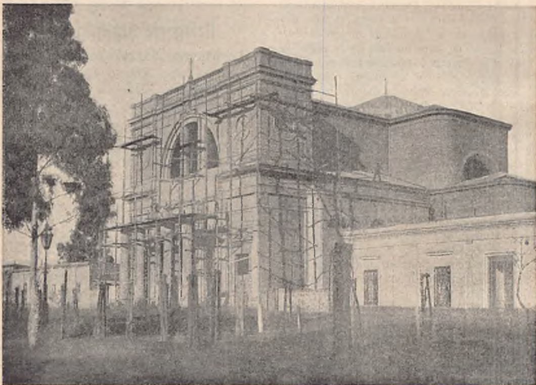
VIEDMA (Rép. Argentine) — La nouvelle église paroissiale.

Il y a, je crois, peu de maisons où l'action salésienne soit aussi multiple et complète comme dans celle de Viedma, où, ainsi que le disait Mgr