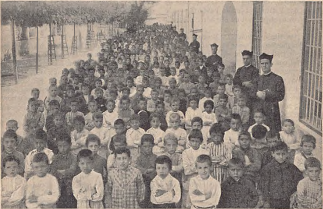
CORDOUE (Espagne) — Élèves de l'Établissement Salésien.

— Pour la bonne marche de vos œuvres, une Société religieuse est indispensable! Et le théologien Borel, qui fut le bras droit du Serviteur