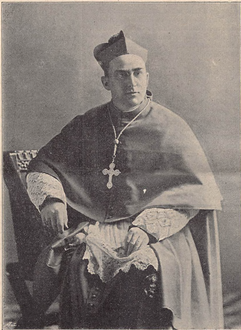
S. G. Mgr FRANÇOIS BOURNE, évêque titulaire d'Épiphanie auxiliaire de Southwark (Londres).

Tous ces évêques, avant de se rendre à Ivrée, voulurent bien passer quelques instants dans notre Oratoire de Turin. L'absence de la maîtrise et de la musique instrumentale, déjà parties pour