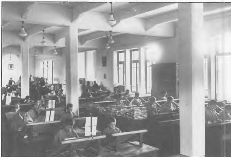
LABORATORIO CALZOLAI - GENOVA SAMPIERDARENA 1937