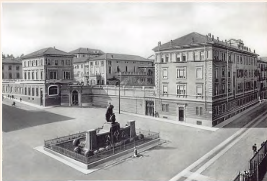
Piazza Maria Ausiliatrice (Torino). Panoramica della Casa generalizia con il monumento a don Bosco. L'11 ottobre 1969 la sede del Consiglio generale verrà trasferita a Roma.