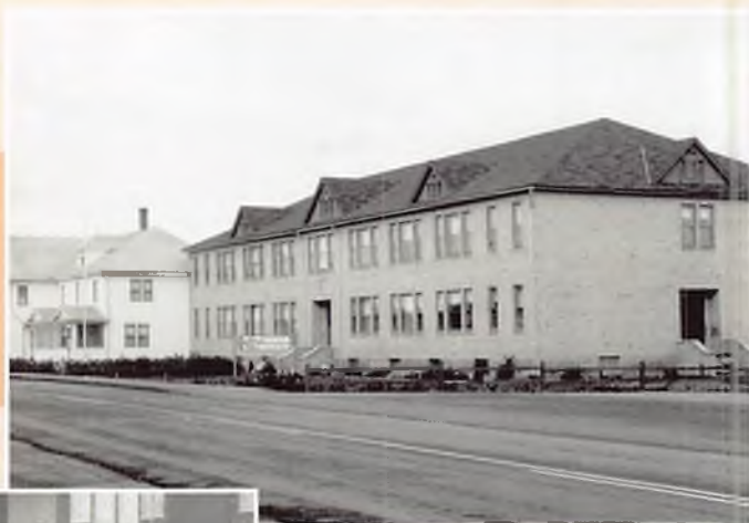
1953 – Point Verte (Canada). Il complesso della casa dove vi era la scuola, l'oratorio e la catechesi.