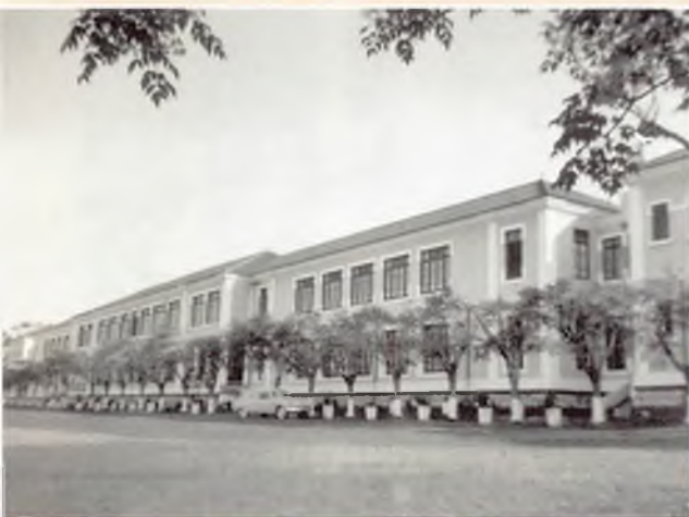
1952 – Namaacha (Mozambico). Parte della Scuola-collegio femminile delle FMA.