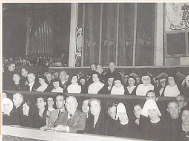
La Madre con il Consiglio generale, partecipa al rito della Canonizzazione.