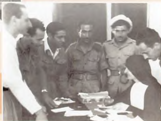
1945 – Roma Stazione Termini al Castro Pretorio. Ufficio accoglienza per militari e reduci.