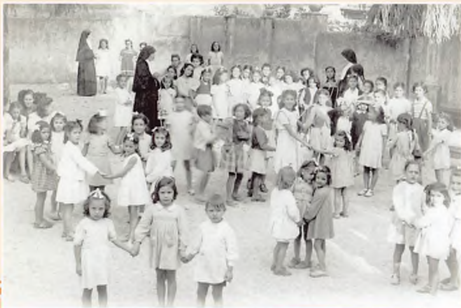
1945 – Roma Istituto “Madre Mazzarello” – Colonia Pontificia per le bambine della strada.