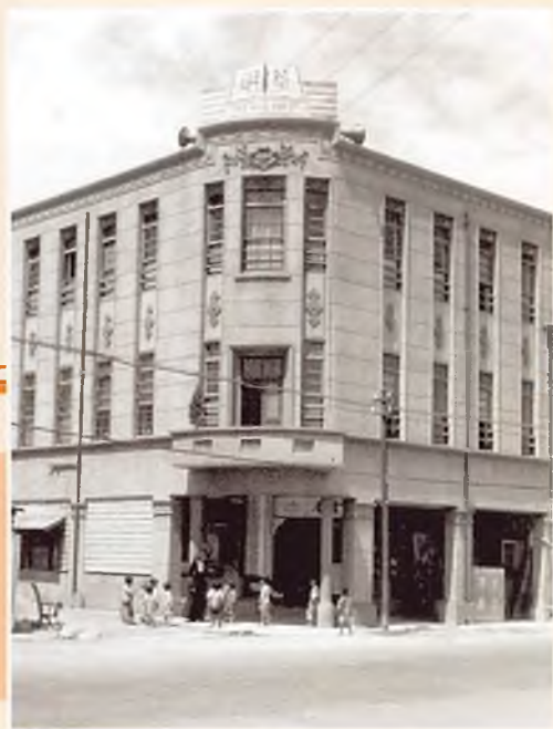
1952 – Kaohsiung (Isola di Formosa). La tipografia salesiana Hua Ming Press dove lavoravano le FMA per la divulgazione della stampa cattolica.