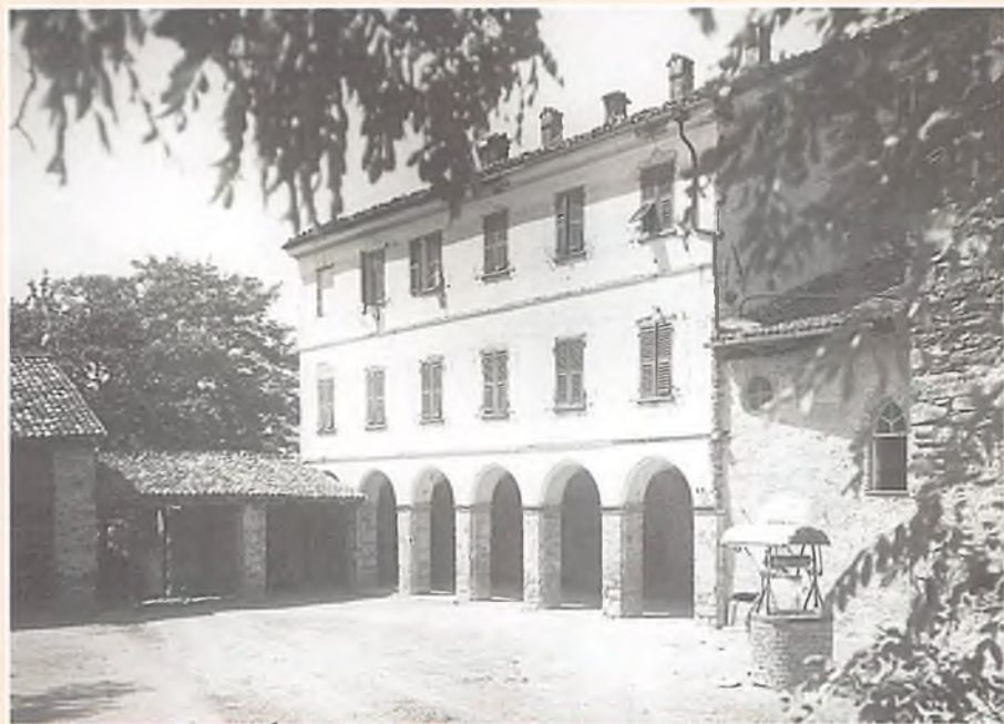
Mornese. Cortile della prima casa aperta da don Bosco per le FMA. Dal 1872 al 1879 suor Maria Mazzarello guidò la comunità.