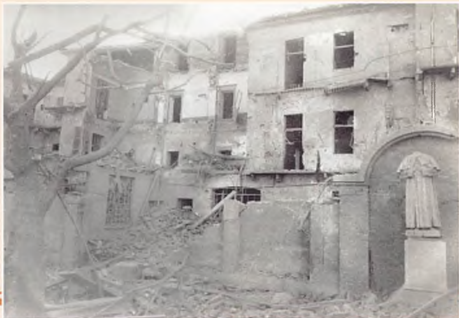
15 aprile 1945 – Alessandria (Italia). La Casa Ispettorale "Maria Ausiliatrice" colpita dalle bombe.