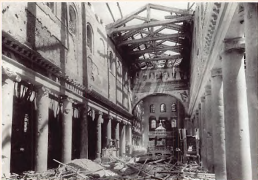
Roma 1943 – 2 a guerra mondiale. La Basilica di San Lorenzo al Verano distrutta dalle bombe.