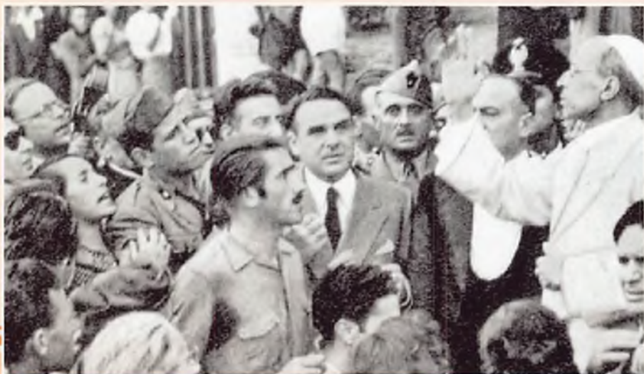
Pio XII conforta gli abitanti di Roma-Tiburtino dopo il bombardamento sulla città.