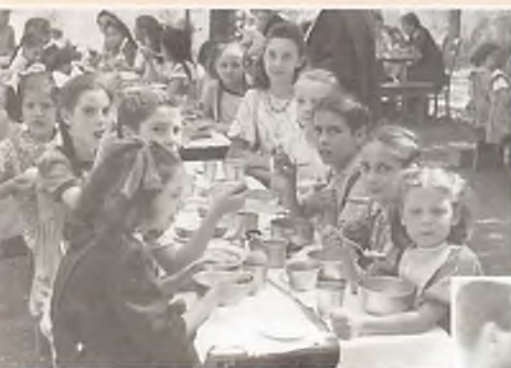
1945 – Colonia Pontificia. Posto di ristoro per le piccole orfane nell'istituto “Maria Ausiliatrice” di Via Marghera 59, Roma.