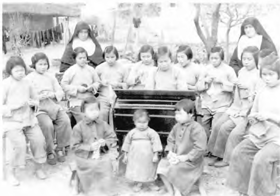
Le piccole cieche della missione di Shiu Chow.