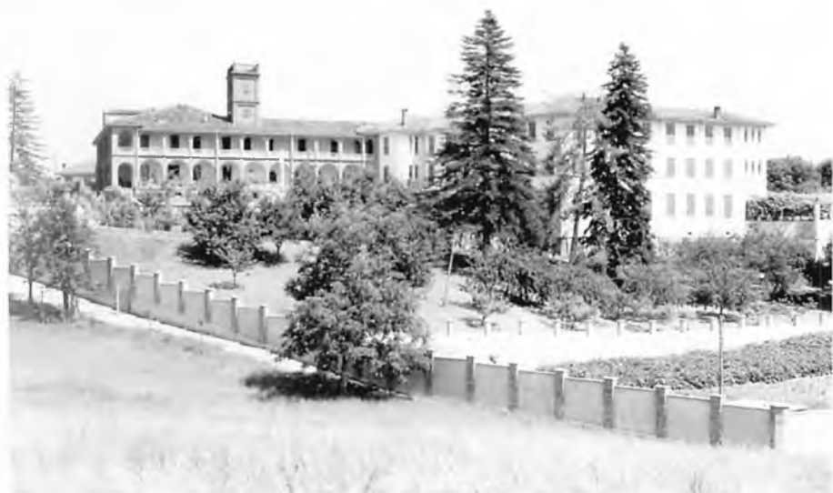
Arignano "Casa Madre Daghero" (1931).