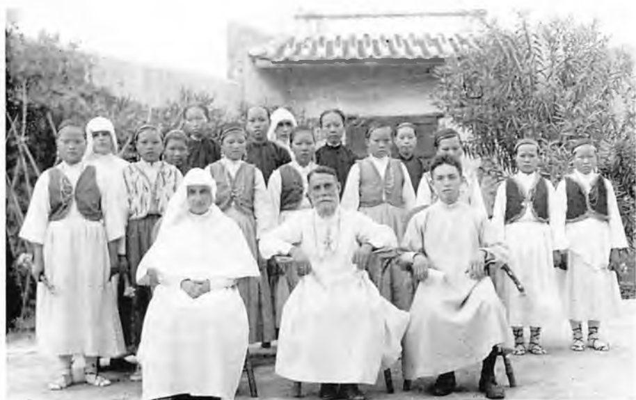
Mons. Luigi Versiglia con le suore e le catechiste.