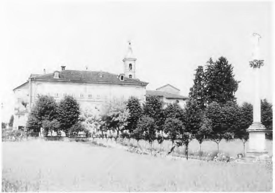
Casanova di Carmagnola (Torino): Noviziato Missionario Internazionale "Sacro Cuore" (1928).