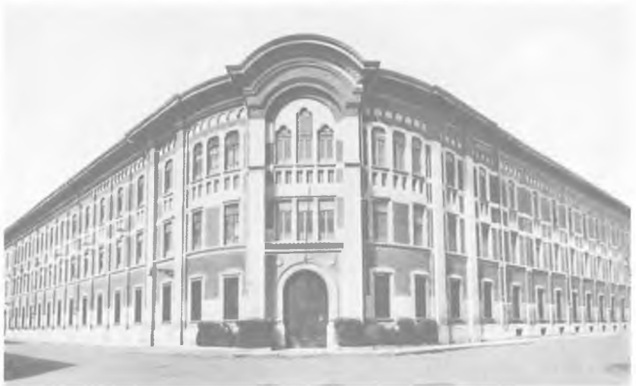
Torino-Borgo S. Paolo: Casa "Madre Mazzarello" per la formazione delle missionarie (1931).