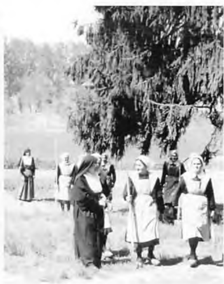
Le aspiranti si esercitano nelle attività agricole tanto importanti per le future missionarie.